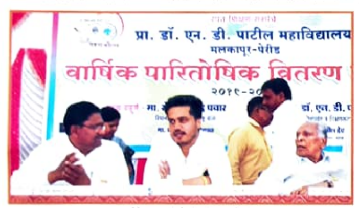
वार्षिक पारितोषिक समारंभ